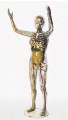
„Gläserne Frau“, 2000 Original: Franz und Fritz Tschackert, 1935/36

© Dresden, Sammlung Schwarzkopf im Deutschen Hygiene-Museum Dresden (DHMD 2020/585); Foto: Gunter Blin sack