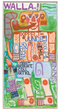
„Doppeltjunge!“, 1987 August Walla