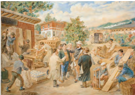
„Moderne Krankenbetreuung“, 1907 August Lancedelli