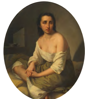
„Eine Wahnsinnige“, 1886 Fortunato Bello