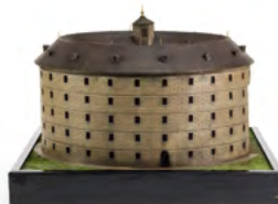
„Narrenturm“, 2. Hälfte 20. Jahrhundert