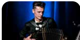
Herbert Pixner © Wriphoto

Informationen & Tickets: www.stadt-kultur.at Ticketauskunft (keine Reservierung) unter 0660 / 11 289 02