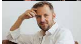
Philipp Hochmair