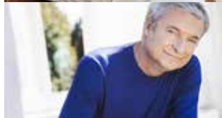
Alfred Dorfer